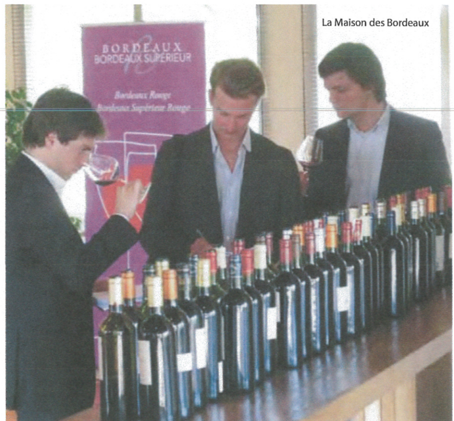
La Maison des Bordeaux

Excellent: La Fleur des Graves. Très Bons: Gaudichaud, Lesparre.