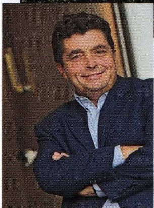
Denis Dubourdieu: Pionier in Sachen trockene Weiße aus Bordeaux.

Rebsorte geht sogar so weit, dass er in der Sauternes-Region einen trocken ausgebauten reinsortigen Weißwein aus der Rebsorte keltert: den wuchtigen 2008er Château Doisy-Daëne, reich an Extrakten und mit kräftiger Säure ausgestattet.